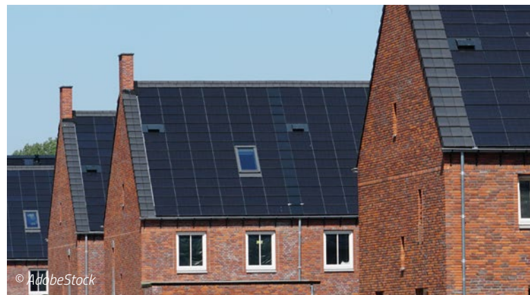
Photovoltaik als Dachintegration

Statt mit herkömmlichen Dachziegeln können Dächer auch mit PV-Dachziegeln oder Dachplatten gedeckt werden. Diese kommen wie normale Ziegel als Dachhaut zum Einsatz, und produzieren zugleich Solarstrom. Durch ihre handliche Form lassen sich PV-Dachziegel unauffällig und passend zum Strombedarf installieren und bieten sich auch für denkmalgeschützte Gebäude an. Die Kosten für eine PV-Anlage mit Solardachziegeln sind im Vergleich zu aufgesetzten PV-Anlagen höher. Zudem erwärmen dachintegriert montierte Module leichter. Bei der Montage muss auf eine ausreichende Hinterlüftung der Module geachtet werden, damit Leistungseinbußen vermieden werden.