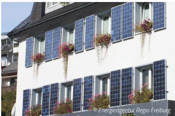
Photovoltaik an der Fassade

tungsmöglichkeiten und ermöglichen zusätzlich die Kombination mit effizienten Dämmsystemen. Durch diese Kombination wird nicht nur klimafreundlich Strom erzeugt, sondern auch für einen niedrigen Wärmebedarf bzw. für sommerlichen Hitzeschutz gesorgt. Das Wichtigste aber ist: Sie sind nicht nur echte Hingucker, sondern produzieren allemal mehr klimafreundlichen Strom als eine Putzfassade. Die Installateure müssen, wie bei Dachanlagen auch, darauf achten, eine Hinterlüftung der Module zu gewährleisten und Anschlussdosen sowie Verkabelung gut zugänglich zu halten.