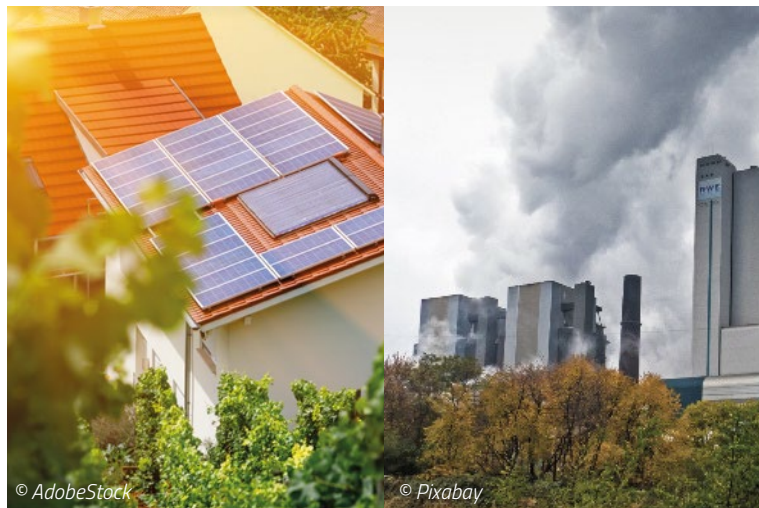
Wählen Sie selbst zwischen Ökostrom aus der Solar-Anlage vom eigenen Dach oder z.B. Kohlestrom aus dem Kraftwerk.

Weitere Nachteile fossiler Brennstoffe, die Gesundheit und Lebensraum des Menschen gefährden, verringert der Einsatz von PV ebenfalls. Denken Sie etwa an den enormen Flächenverbrauch durch den Abbau von Braunkohle!