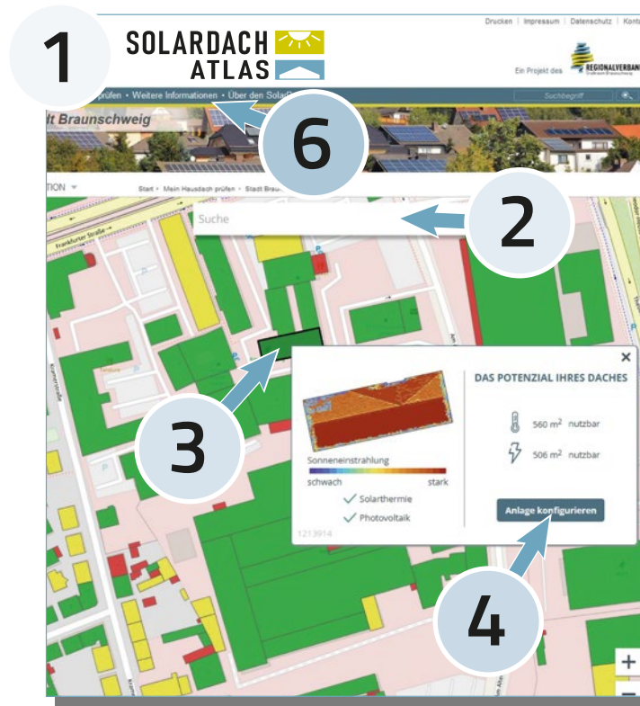
Ausschnitt Webseite SolarDachAtlas